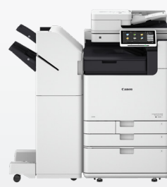
iR ADV DX 6800