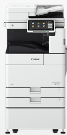
iR ADV DX 4700