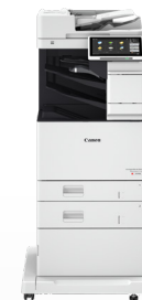
iR ADV DX C478